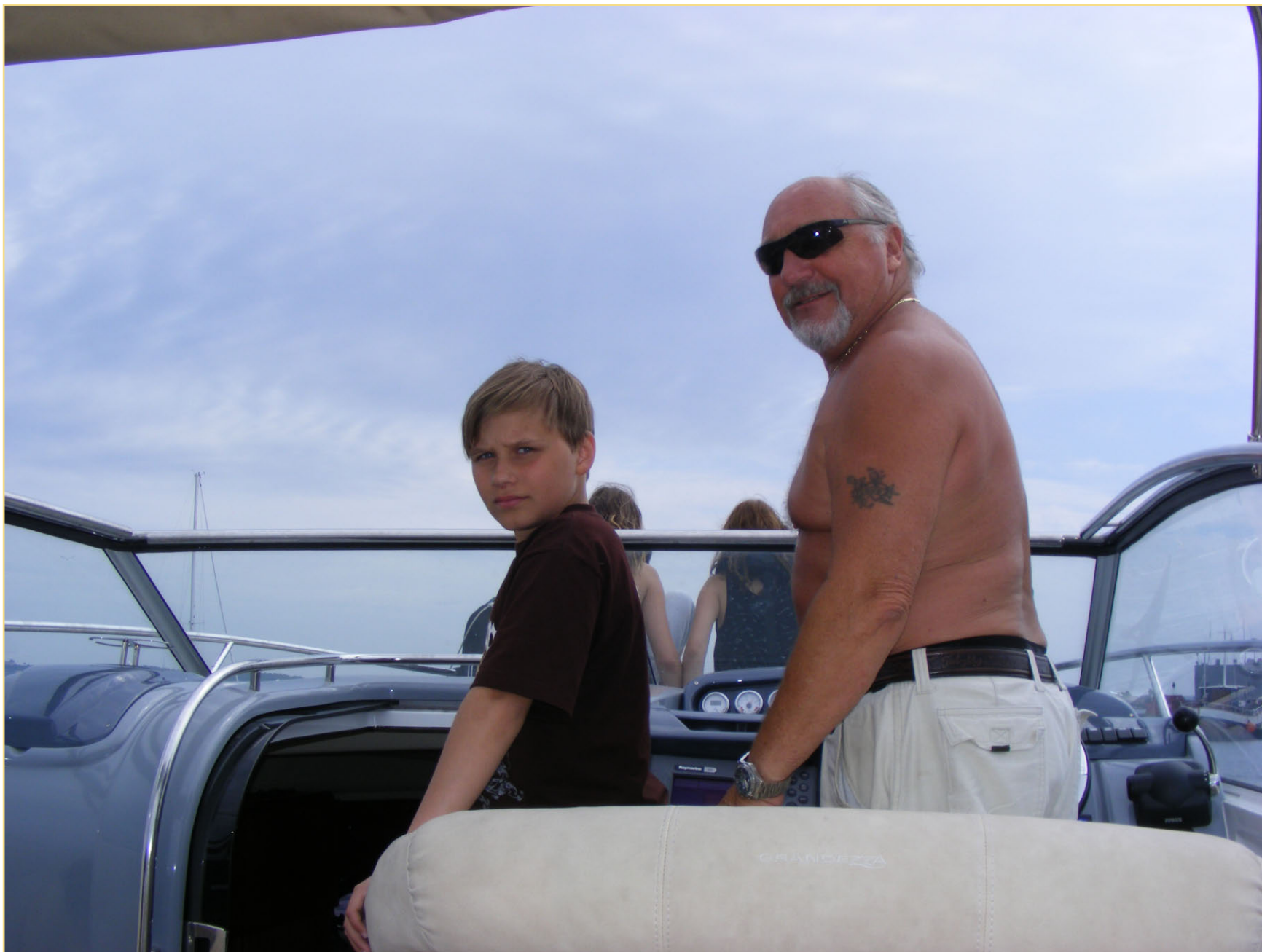
to generasjoner båtfolk