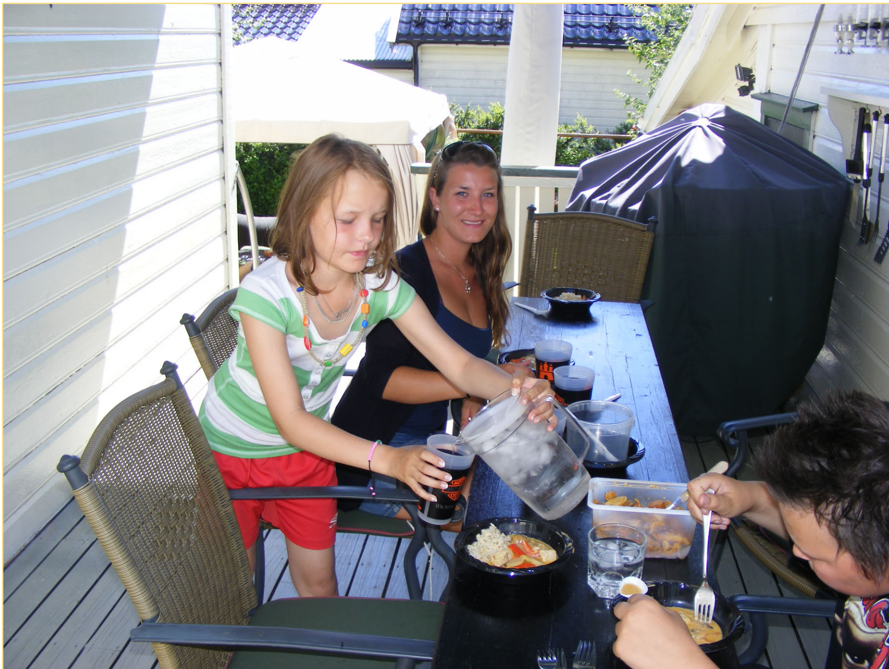
Vann er godt