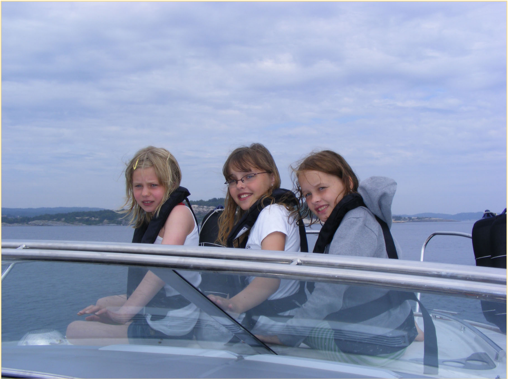
Vi liker å sitte forran på båten