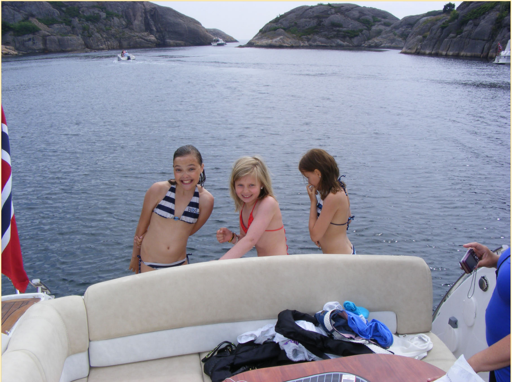
Malin var først uti