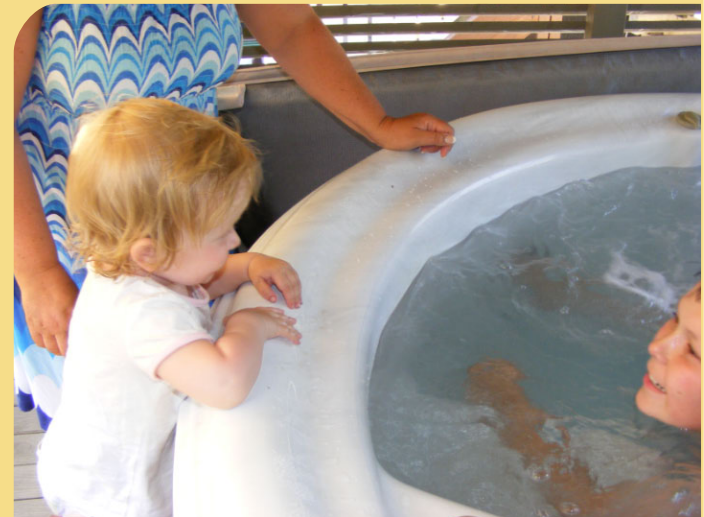
Thea vil også bade