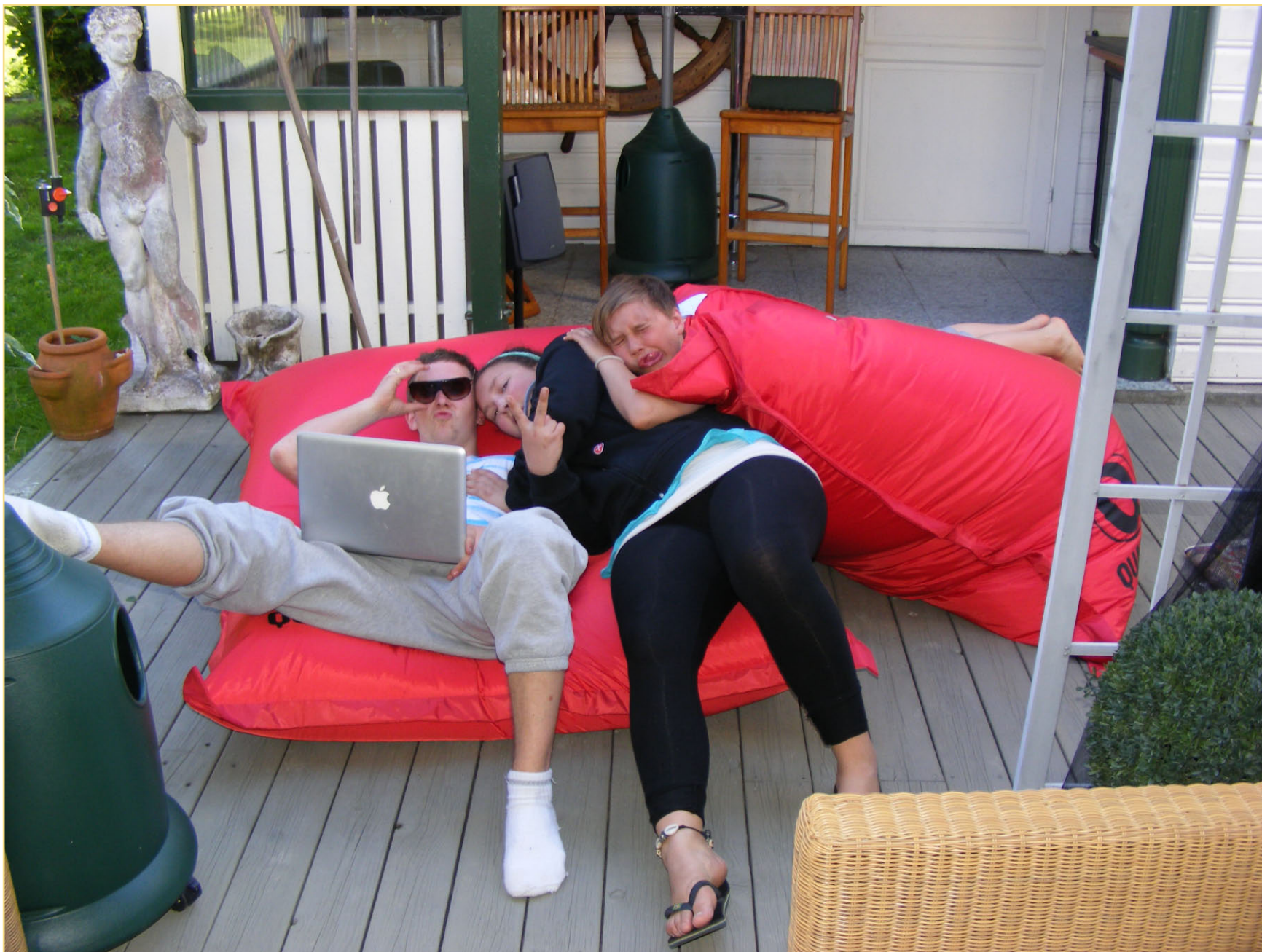
Ungdommen later seg med PC-en