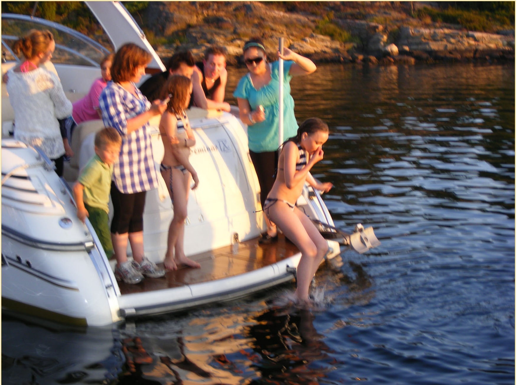
Malin hopper igjen