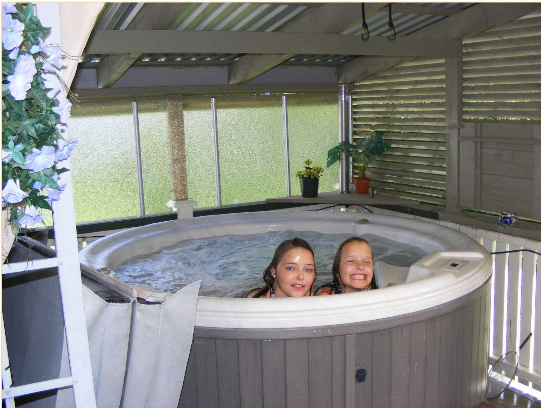
Så var det tid for sommerferie hos bestefar