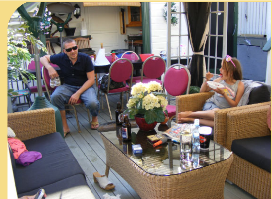
Jordbær er best