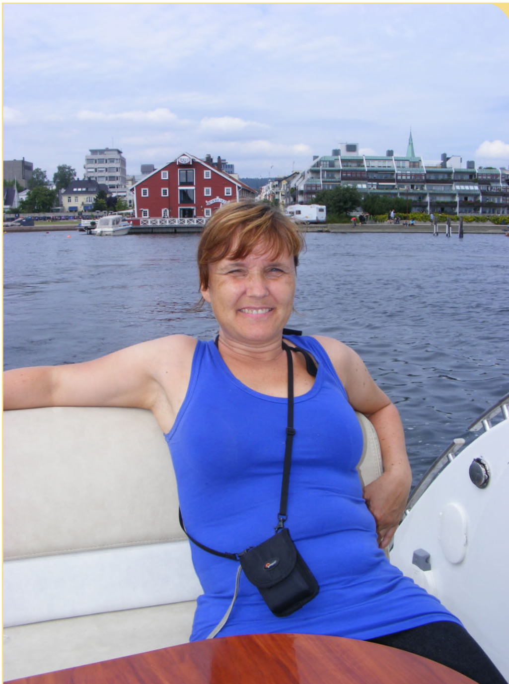
Gry koser seg ombord