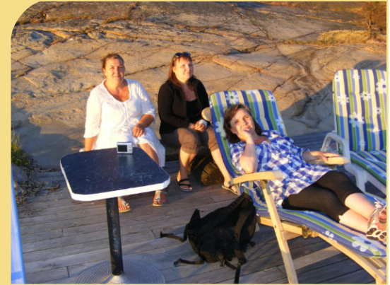
Tre søstre koser seg på St.hans 2009