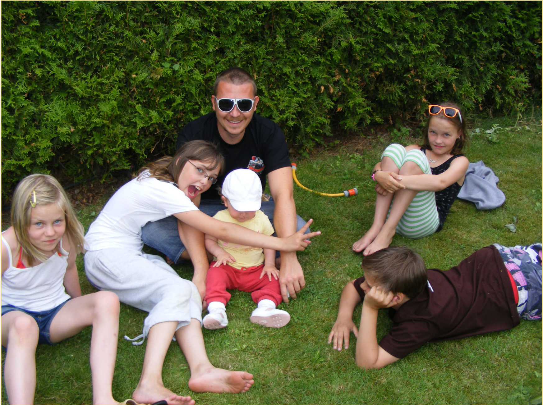
Malin da, skjærp dæ