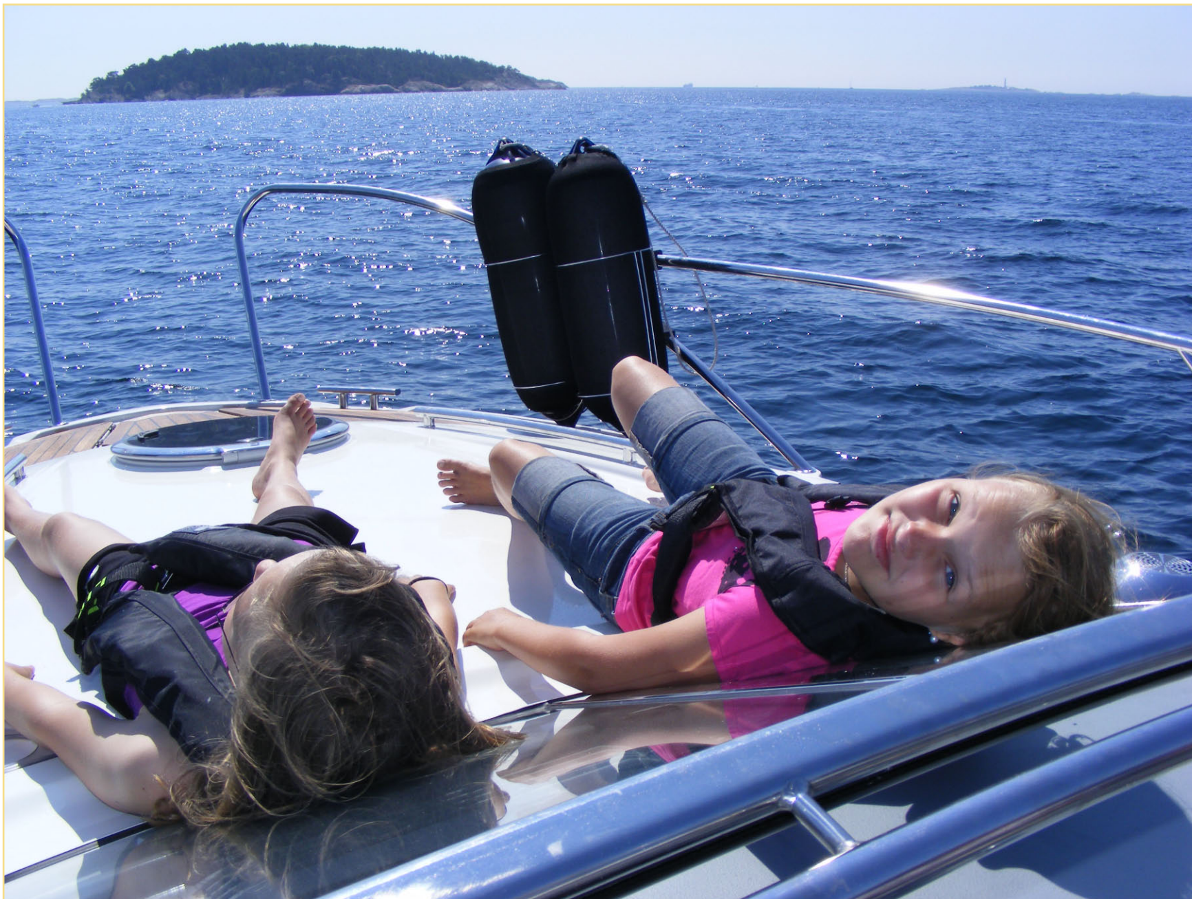
Og vi soler oss på fordekket