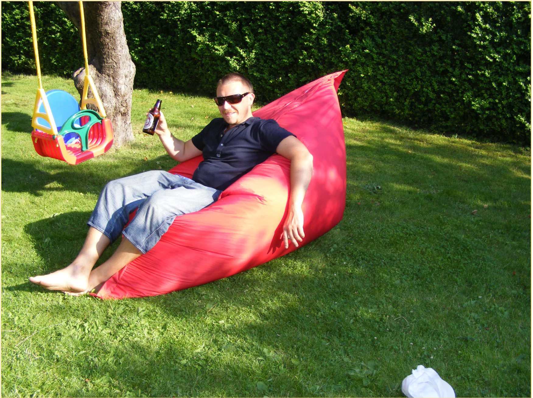
Jr. slapper av med CB pils