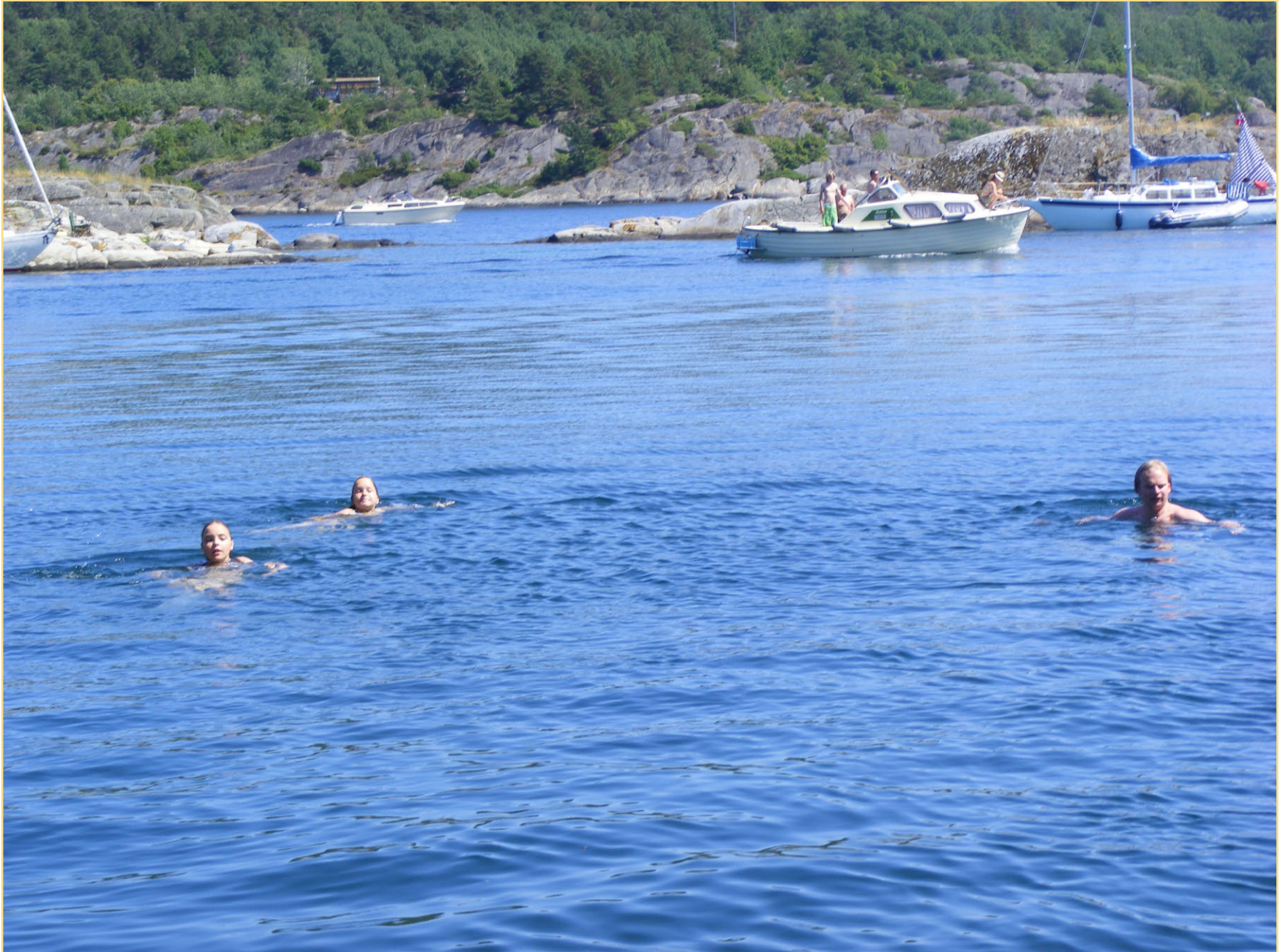
Sørlandet er best