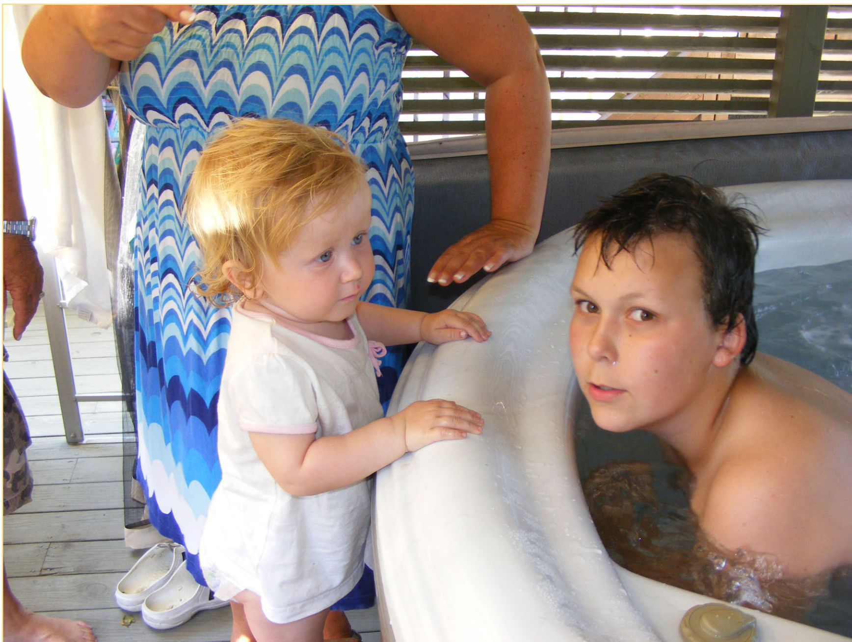
Jeg vil bade NÅ