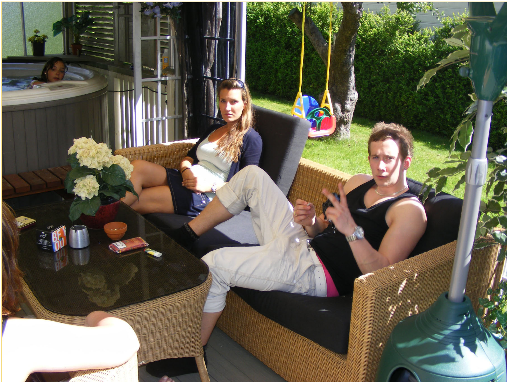
Kos i VIP avdelingen