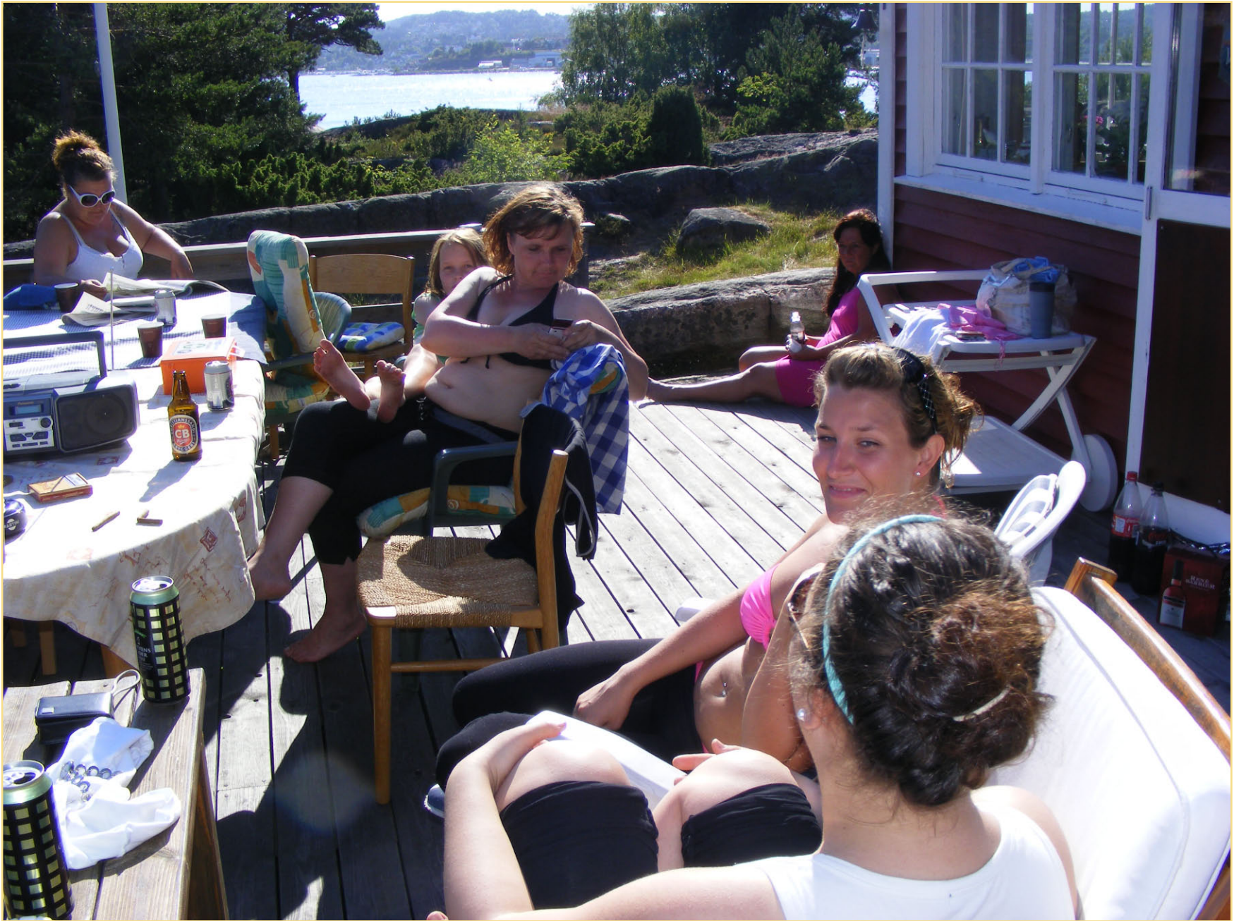
Alle venter på mat