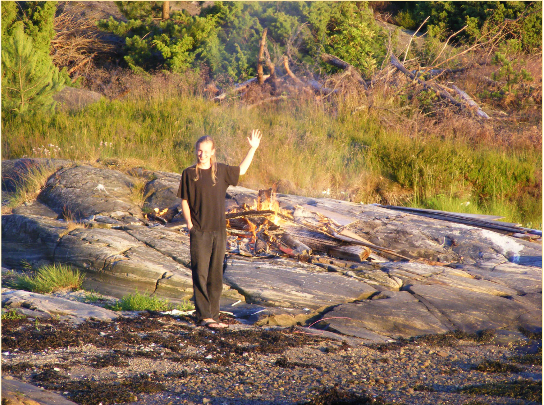
Jeg tenner bålet i år