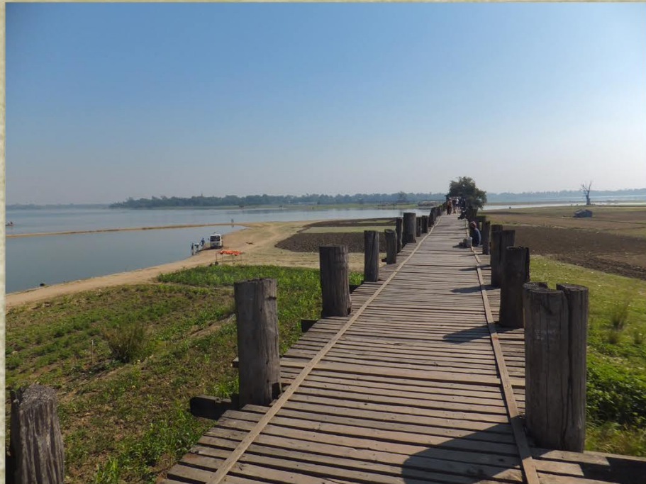
Denne bruene U Bein er fra 1782 og er 1,2 km lang og laget av teak.