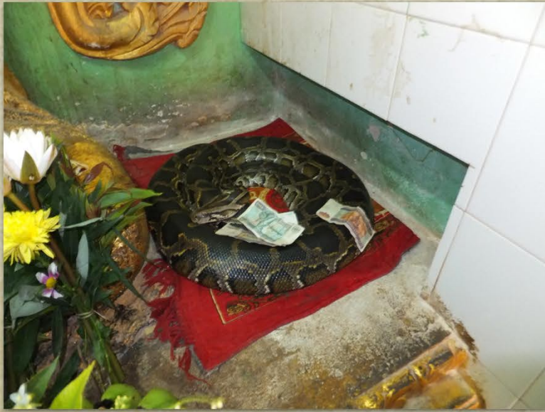
Også slanger fikk penger