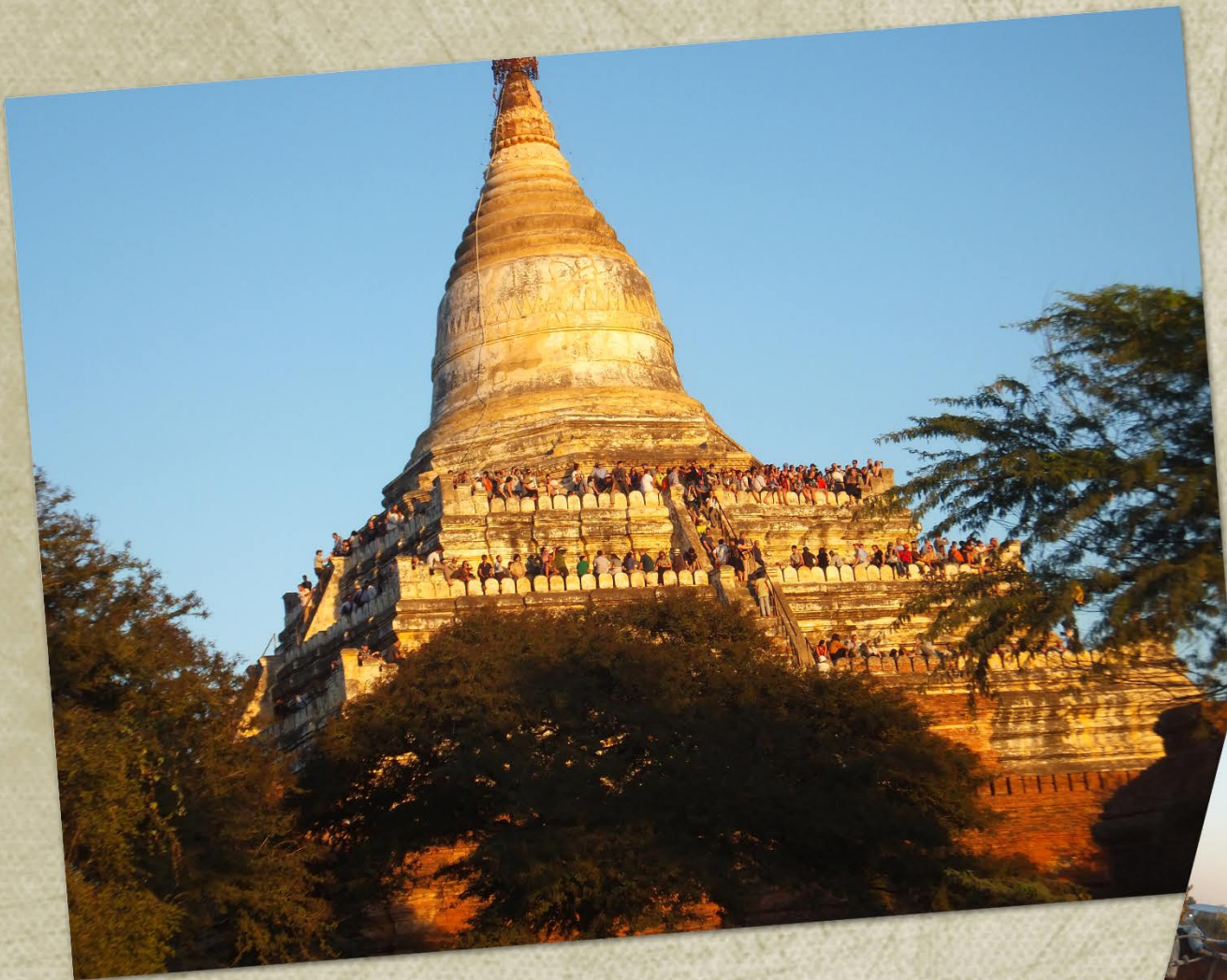
Solnedgang over templet