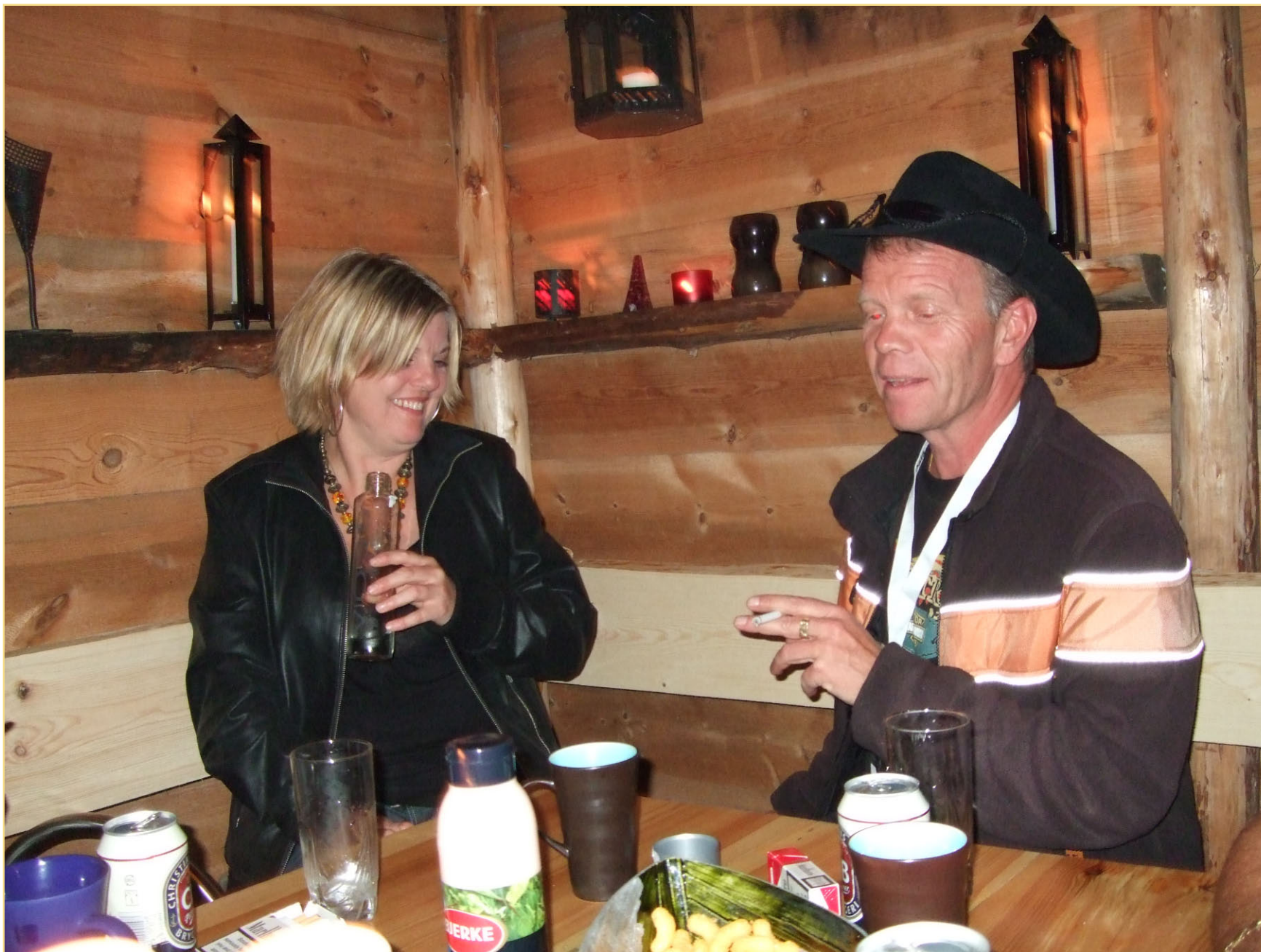
Ok da en røyk til