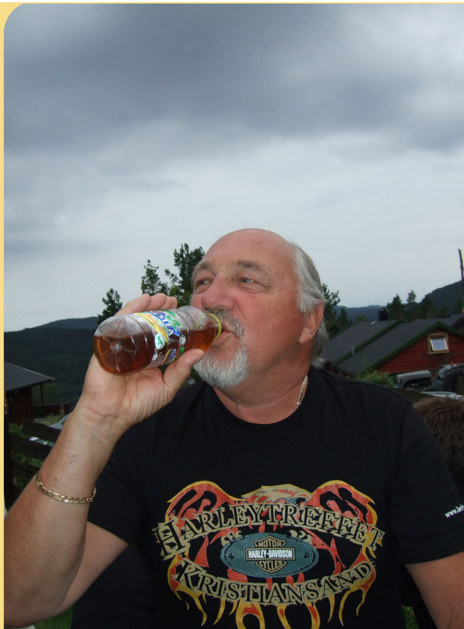
Her er beviset flink gutt