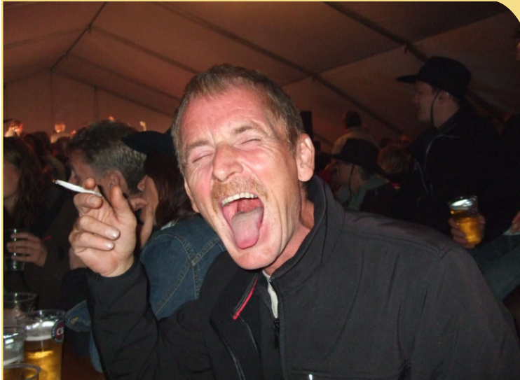
Men Terje da