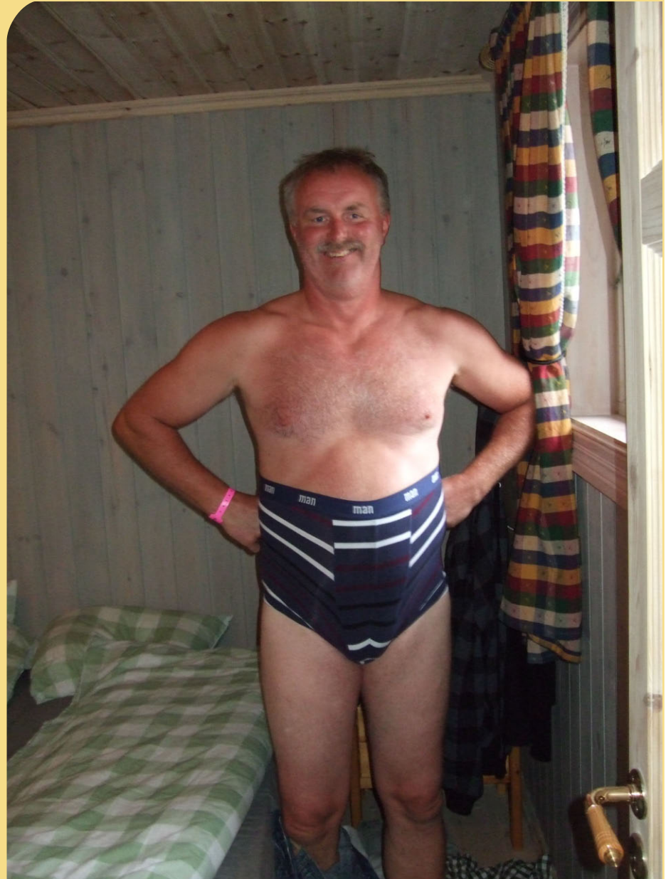
Pees skal kle seg for kvelden