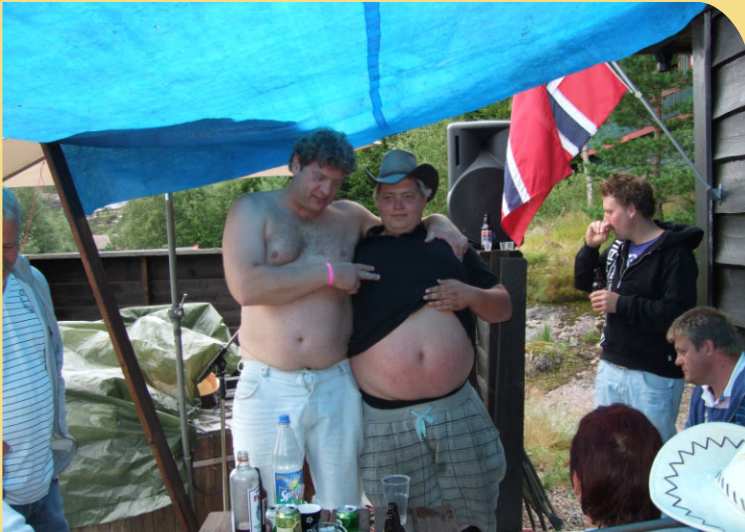
Vel, ingen kommentar