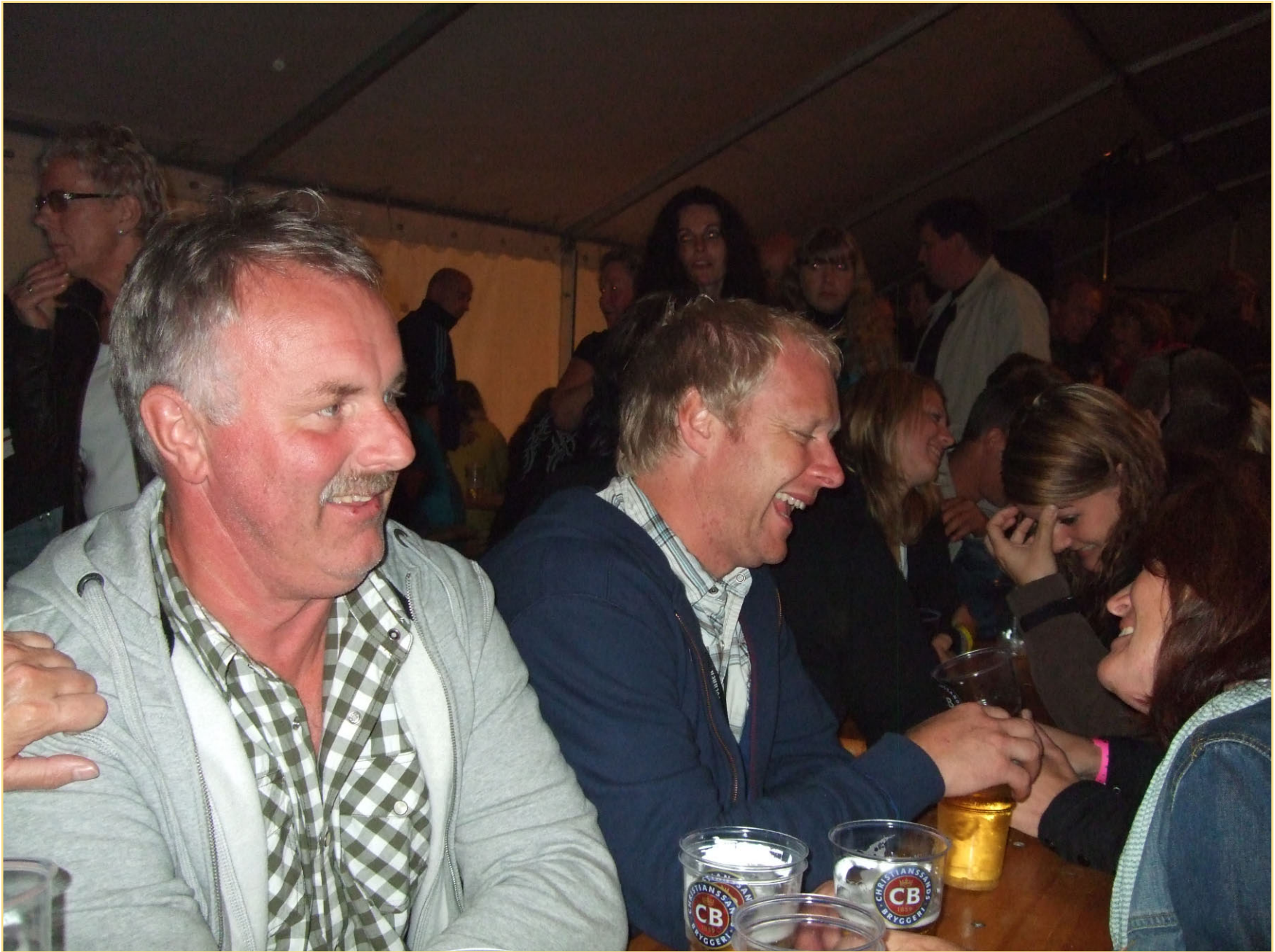
Uff uff for mye drikking her