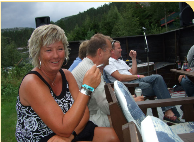
Er jeg brun eller?