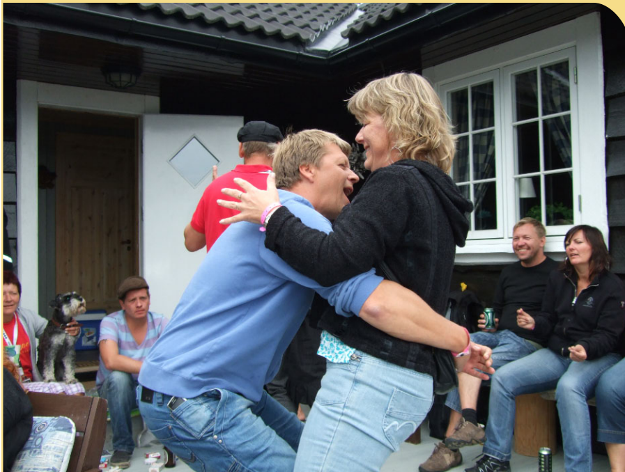
Å hei og hå