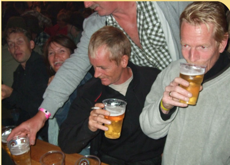
Ja øl driker vi mye av