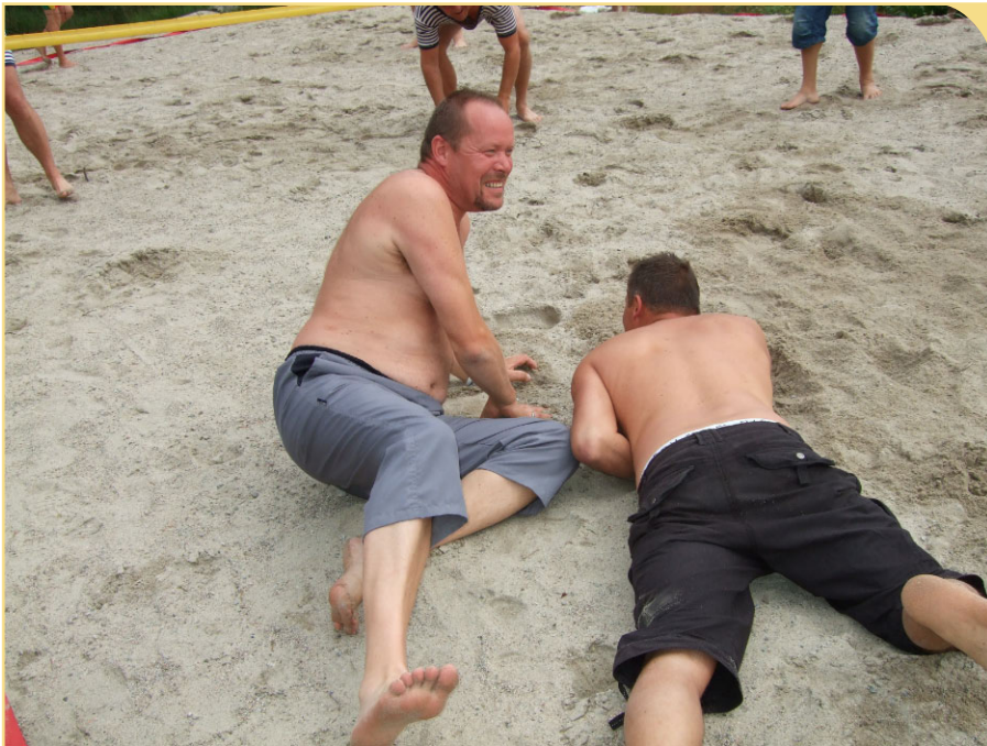
De ga ALT