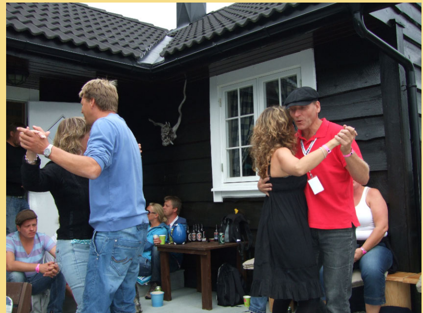
Å dansen går