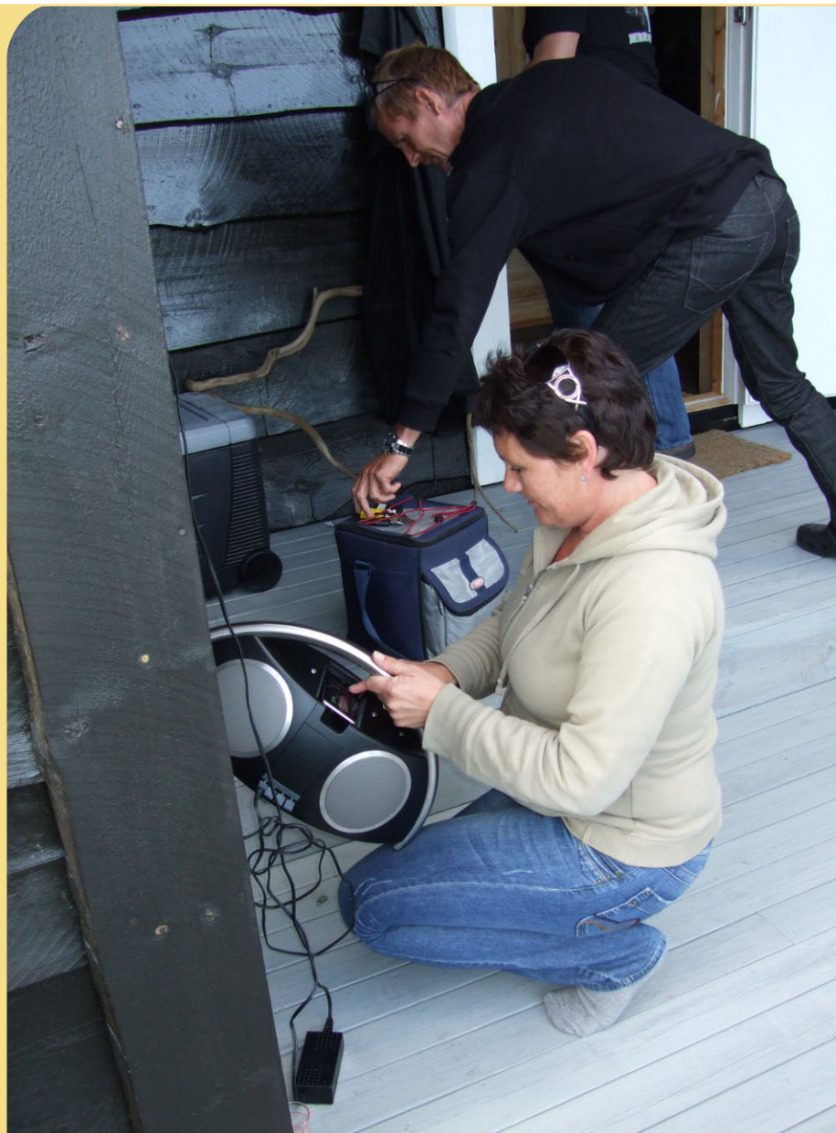
Se det hjælper