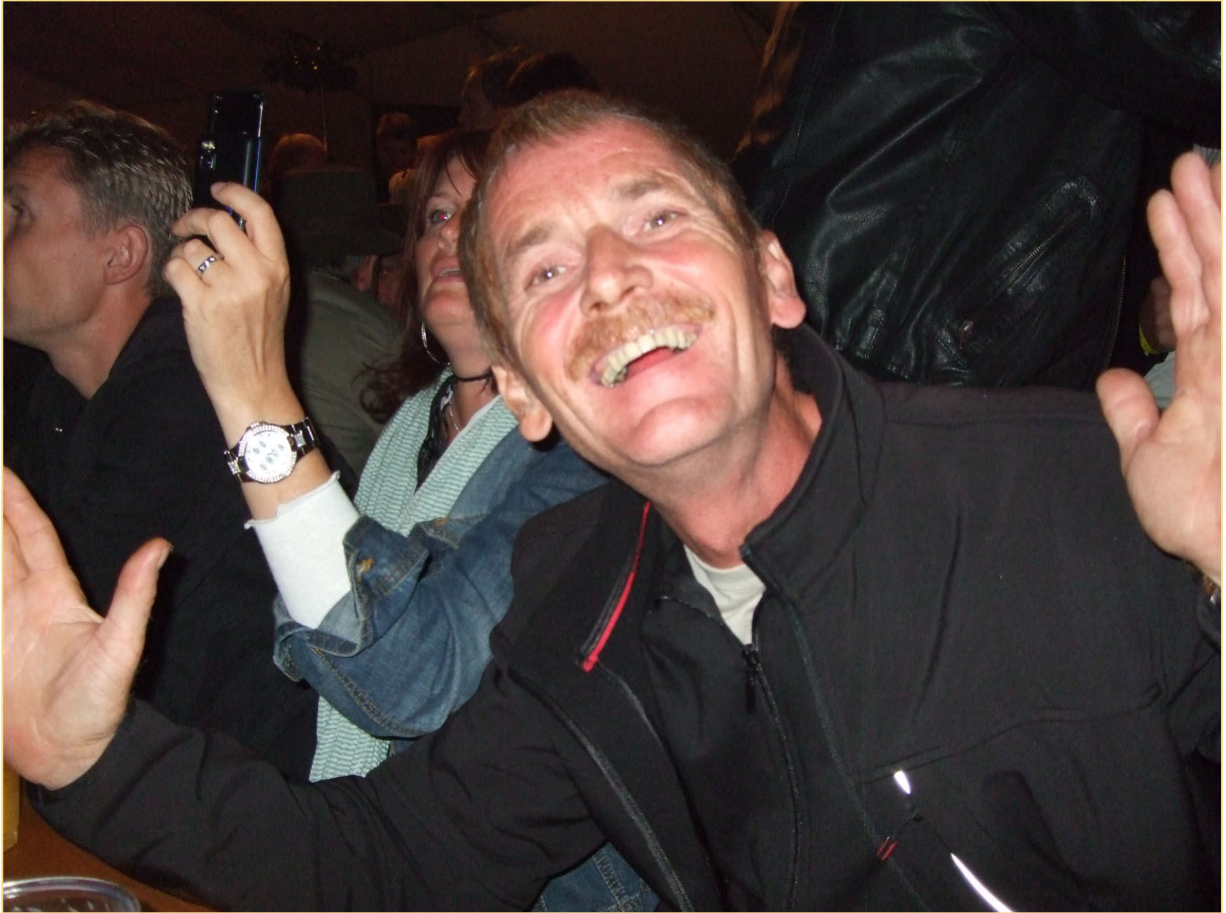
Syng og vær glad