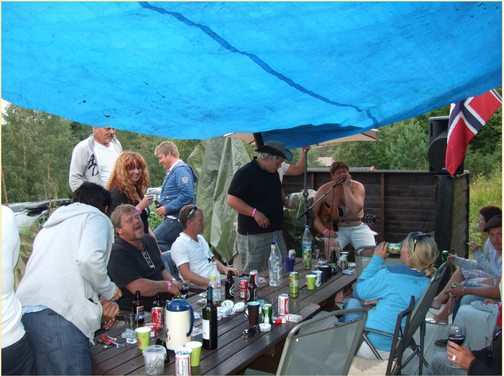
Litt regn fikk vi men det gjorde ingenting