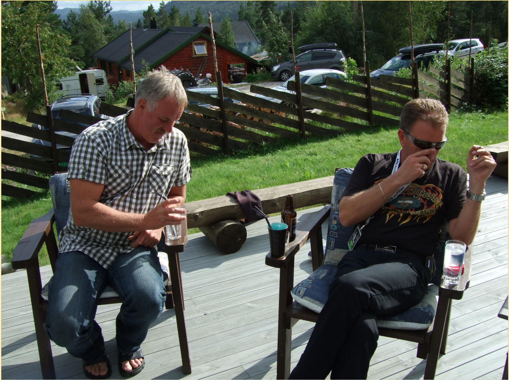
Uff of uff gin tonnik