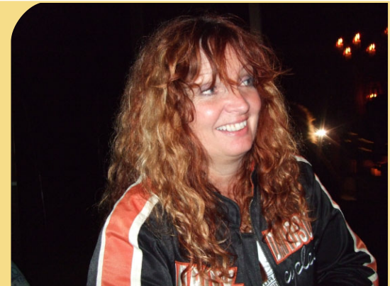
Marit er ennå med