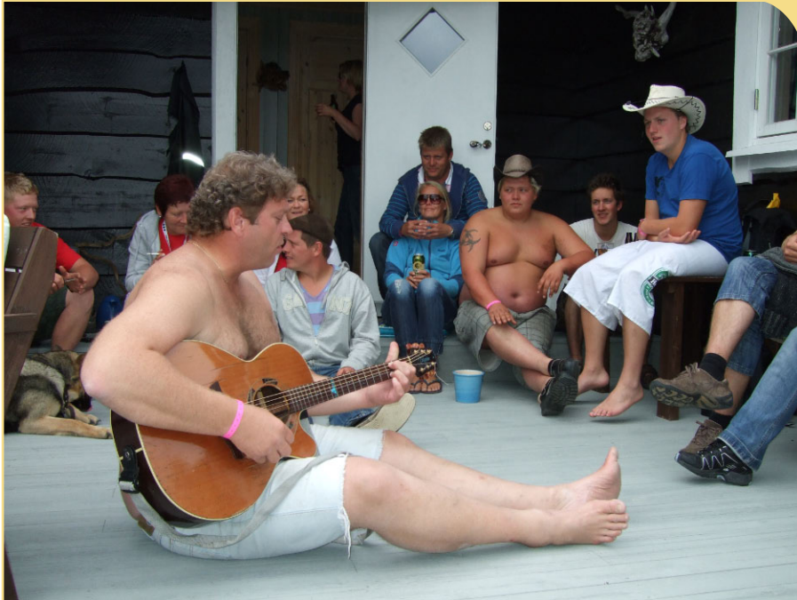
Rock en roll