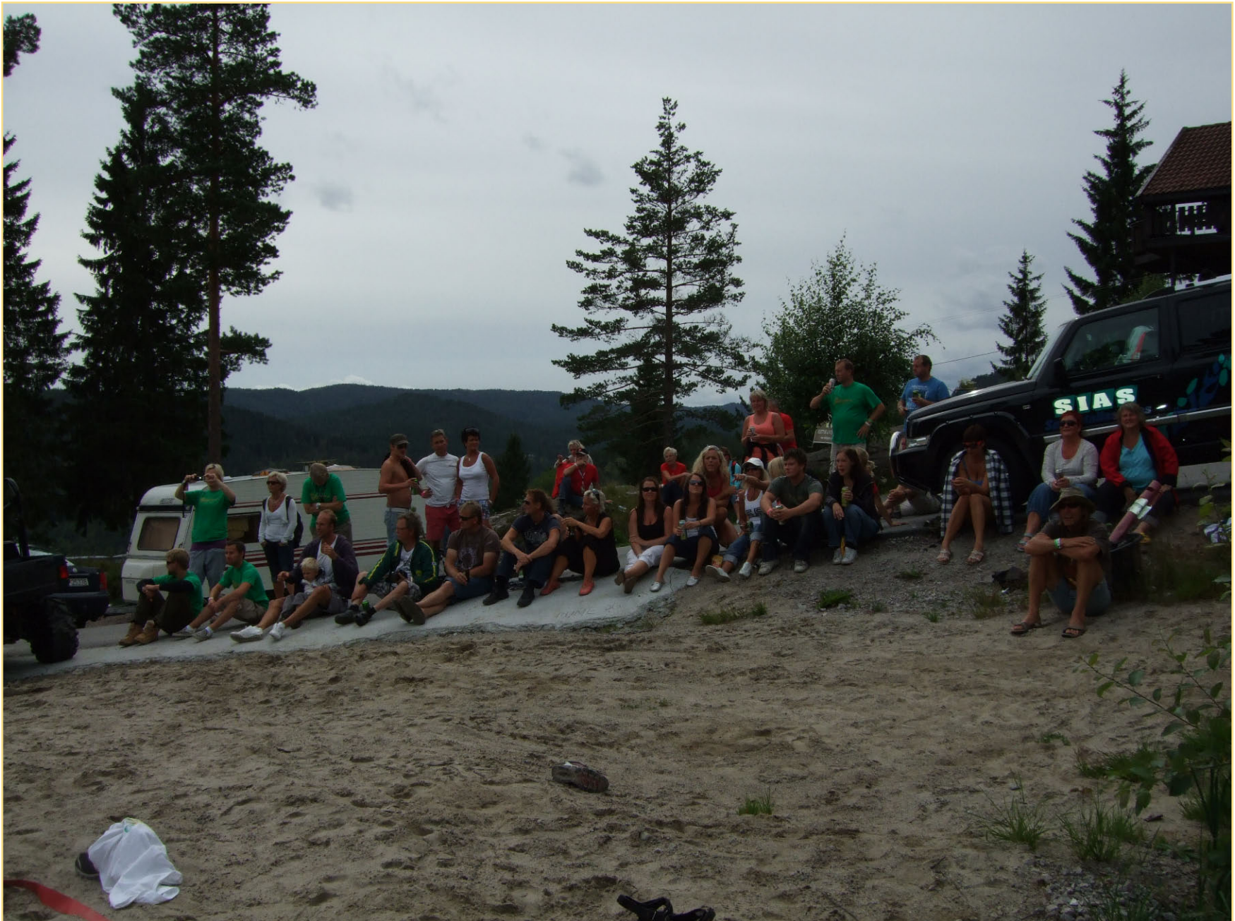
Publikum koser seg