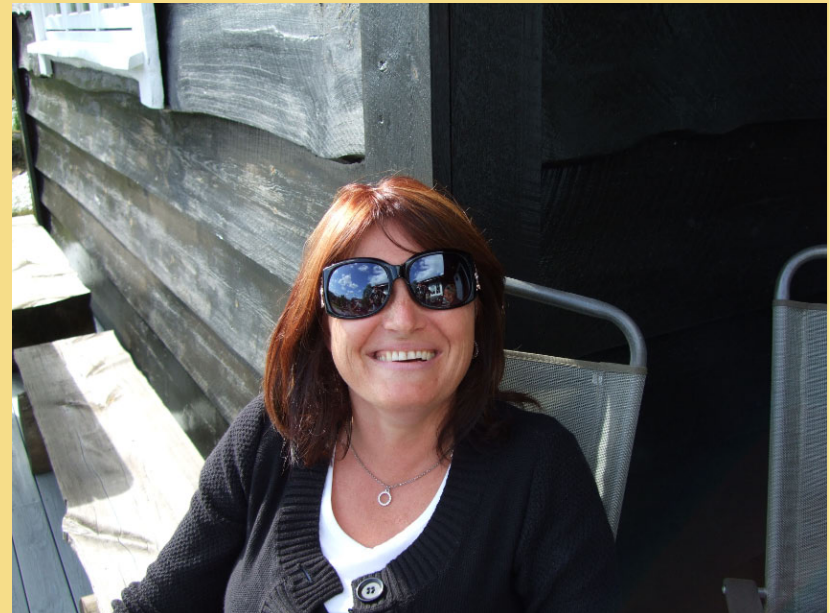
Me he det bra