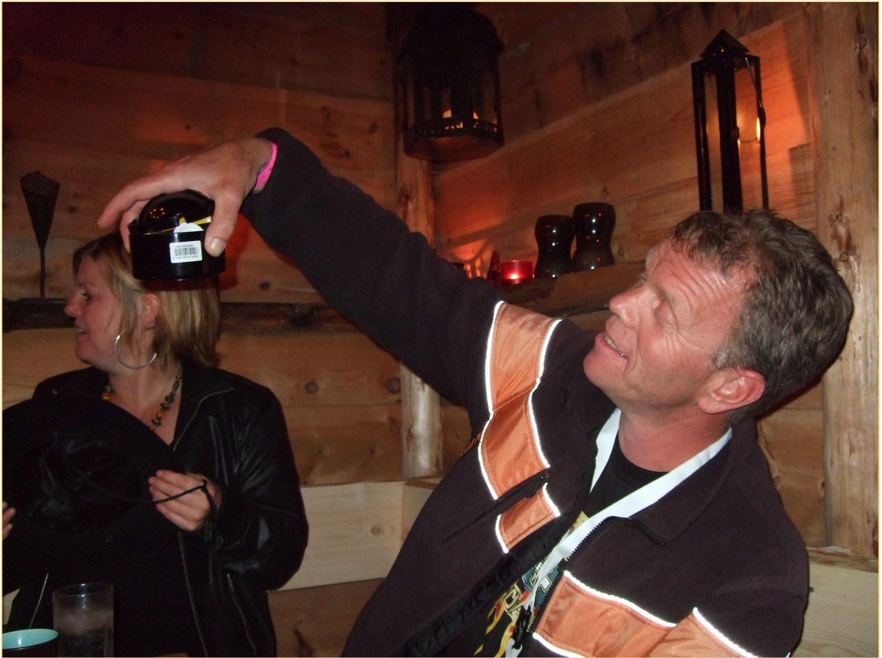
Se hvor pent det er ikke sant og bare MITT