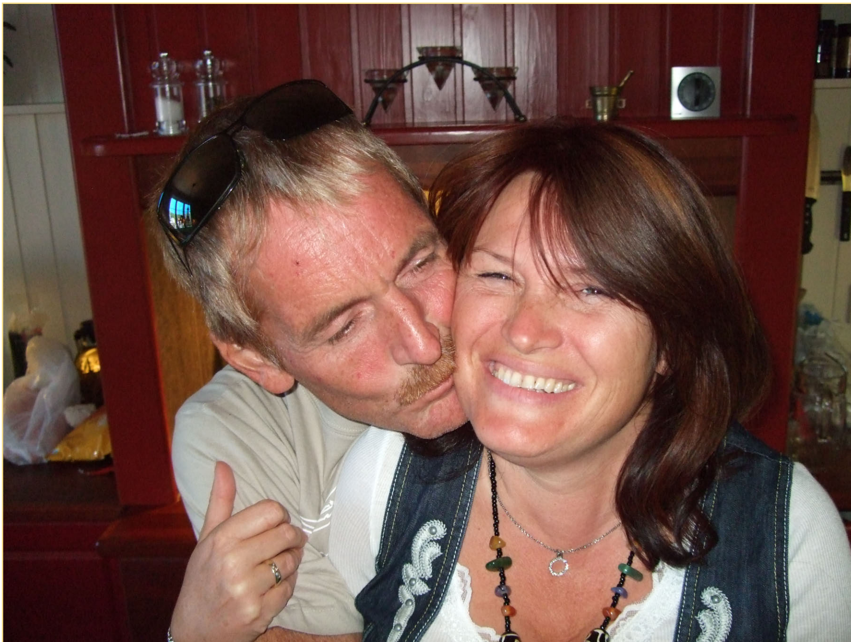
Nygifte å så var det over for i år sees neste år