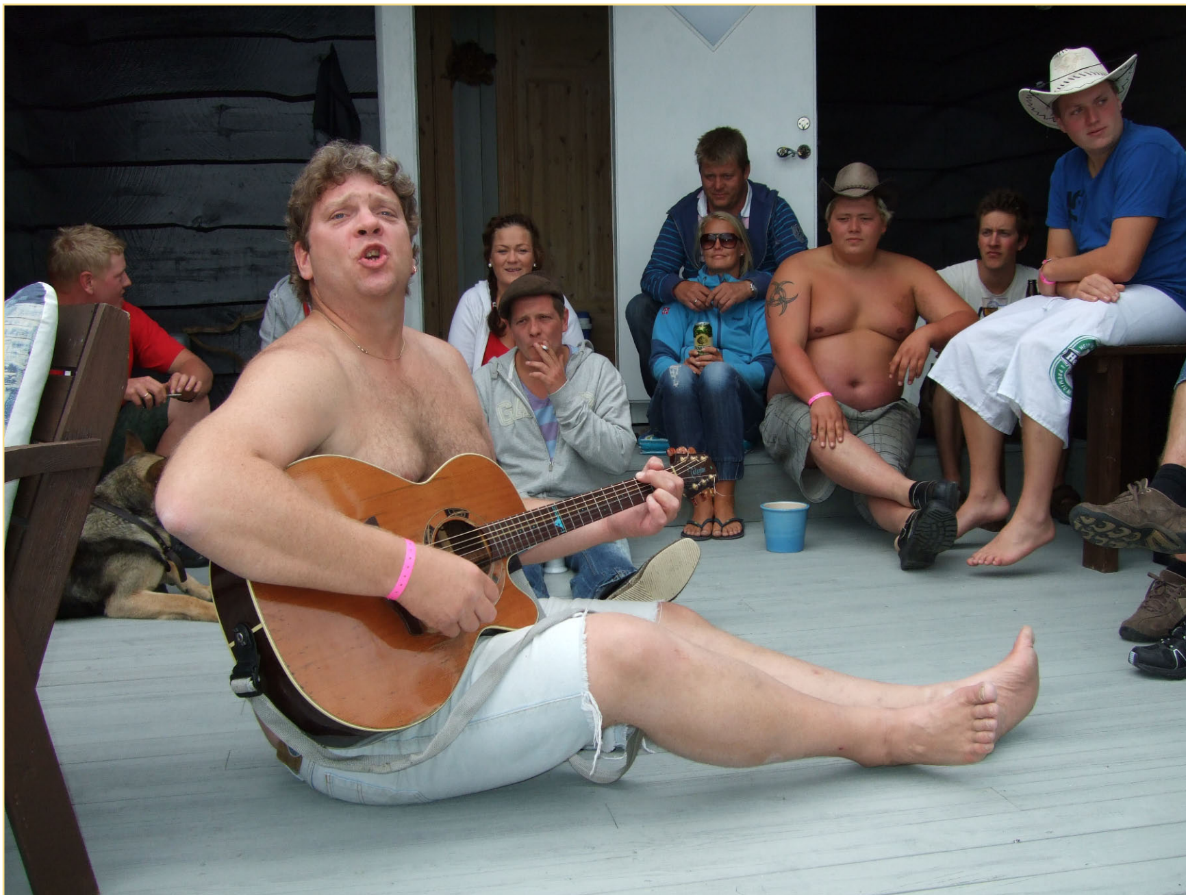
Sitte komp til sangen