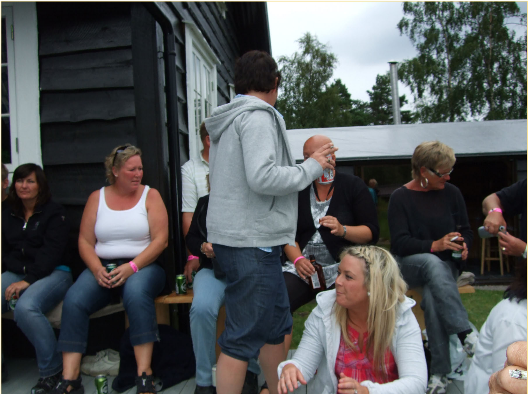
Alle koser seg