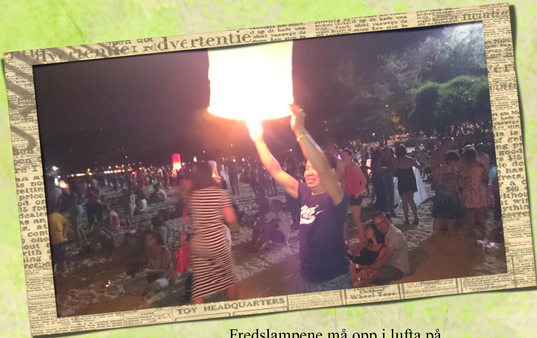
Fredslampene må opp i lufta på nyttårsaften