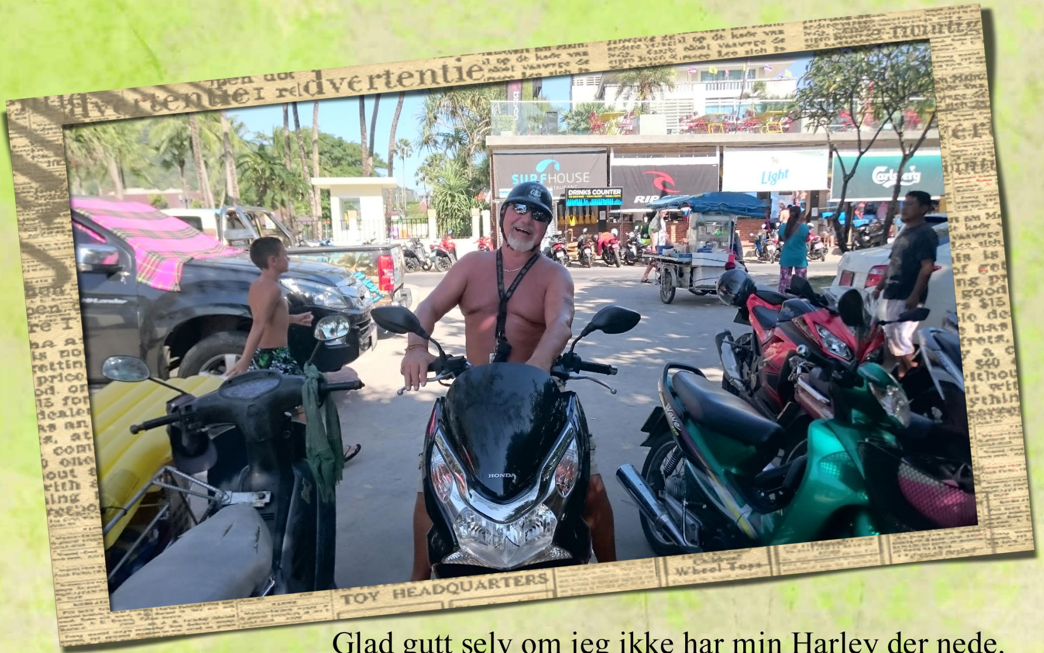
Glad gutt selv om jeg ikke har min Harley der nede.