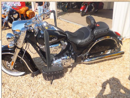
Magnar trives også på en Indian