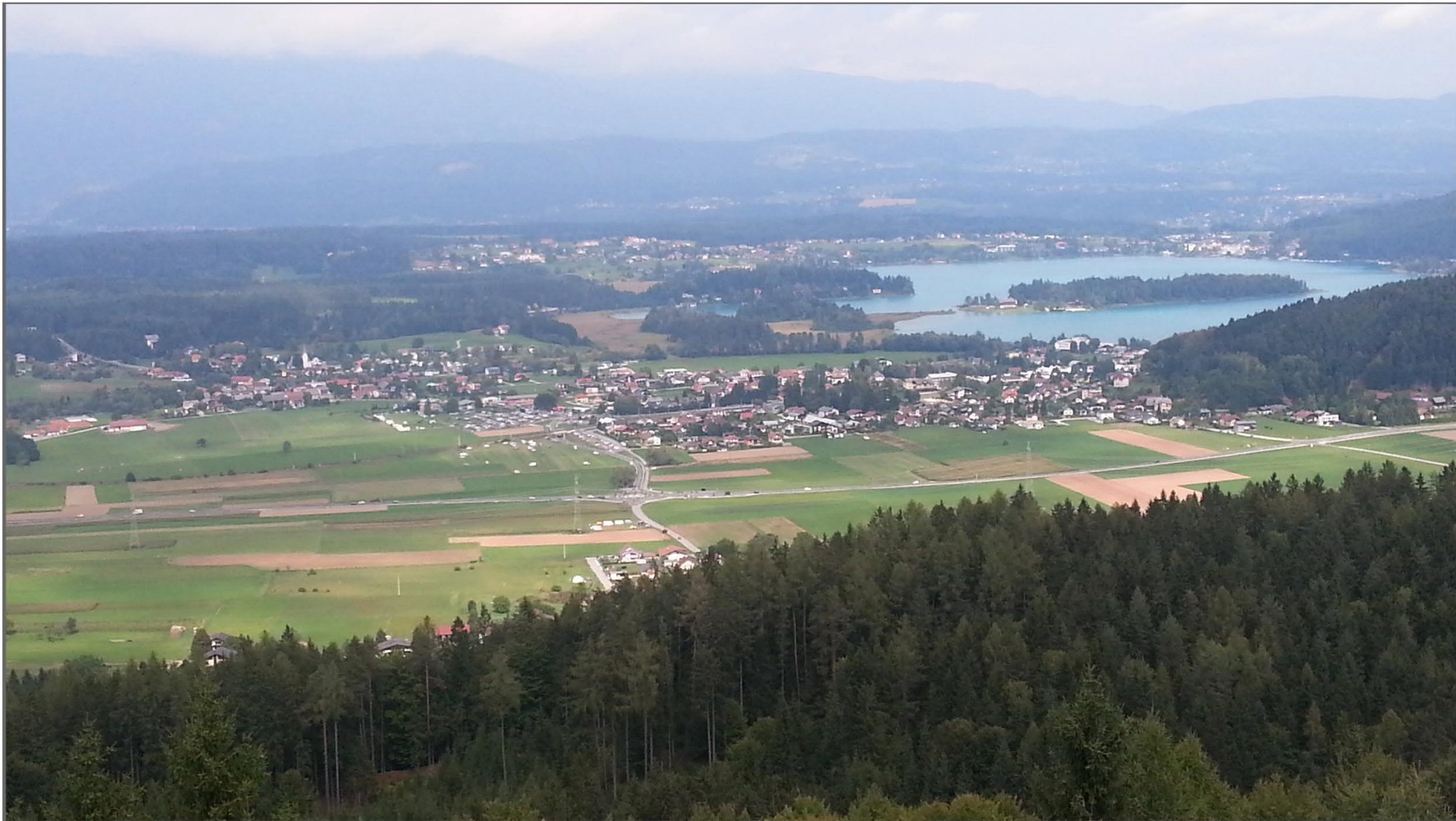
Utsikt over Faker See fra borgen oppe i fjellet. Vi ser øyen som ligger i Faker See, den heter "Haleywood"